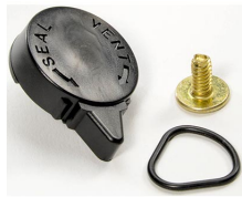
iM-VALVE-M-B Válvula de purga manual