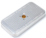
1500D Gel de sílice desecante