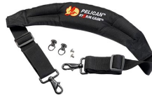
iM-STRAP-S-VER2 Correa para hombro acolchada