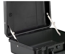
iM-LIDSTAY Soporte de tapa