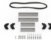
iM20XX-M4-BEZEL Bisel de la base (métrico)