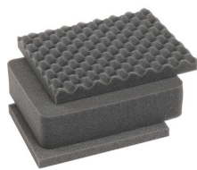
iM2050-FOAM Juego de 3 piezas de espuma de recambio