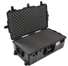
1615WF With Foam