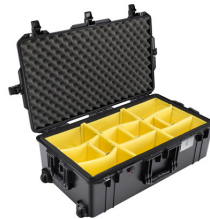
1615WD With Padded Dividers