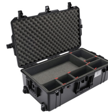
1615TP With TrekPak Divider System