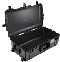
1615NF No Foam