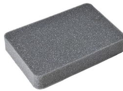
1012 Pick N Pluck™ Foam Insert