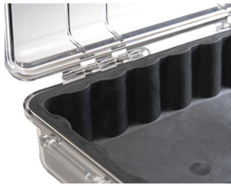
1011 Replacement Case Liner