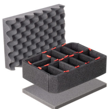
iM2100TPKIT Kit de divisores TrekPak