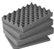
iM2100-FOAM Juego de 4 piezas de espuma de recambio