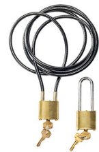
CL2 Câble de verrouillage (double)