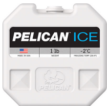
PI-1LB Bloc réfrigérant 1 lb