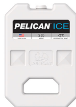
PI-2LB Bloc réfrigérant 2 lb