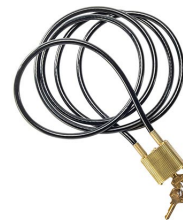
CL1 Câble de verrouillage