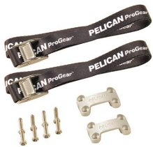
TKIT Trousse de fixation