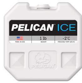
PI-1LB Bloc réfrigérant 1 lb