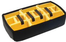
1535AirDS Cloison en mousse