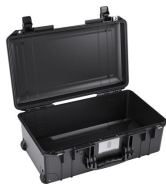
1535NF No Foam