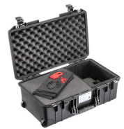
1535AIRTPF TrekPak / Foam Hybrid