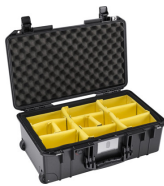
1535WD With Padded Dividers