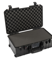
1535WF With Foam