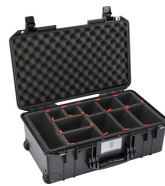
1535TP With TrekPak Divider System