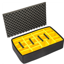
1675 Cloison en mousse