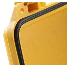
1623 Joint torique de remplacement