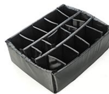
1615 Cloison en mousse