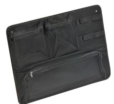
1569 Pochette couvercle