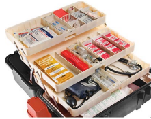
1466 Système de plateau pour 1460EMS