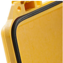
1463 Joint torique de remplacement