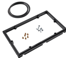
1120PF Cadre de panneau pour application spéciale