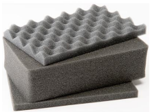
1121 Jeu de mousses de rechange, 3 pièces