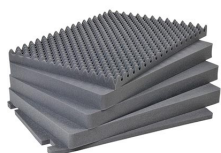
1731 Jeu de mousses de rechange, 5 pièces