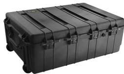
1730NF No Foam