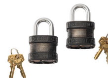
PL2 Cadenas (ensemble de 2)