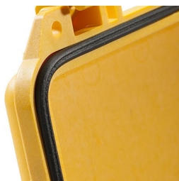
1703 Joint torique de remplacement