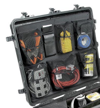
1699 Pochette couvercle