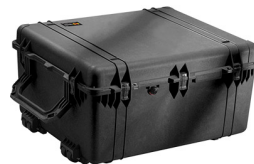
1690NF No Foam