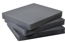
1692 Pick N Pluck; sections seulement (jeu de 3)