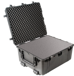
1690WF With Foam