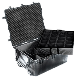
1694 With Padded Dividers