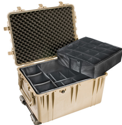
1664 With Padded Dividers