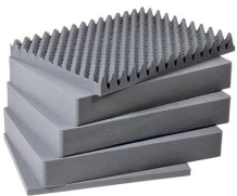
1661 Jeu de mousses de rechange, 5 pièces