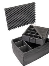
1665 Cloison en mousse