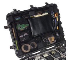
1669 Photo/Pochette couvercle