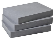
1662 Pick N Pluck; sections seulement (jeu de 3)