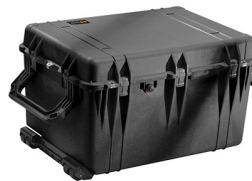
1660NF No Foam