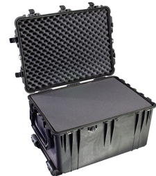
1660WF With Foam