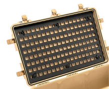
1650MP EZ-Click™ MOLLE Panel