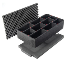
1650TPKIT Kit de séparation de la valise TrekPak