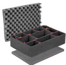
1520TPKIT Kit de séparation de la valise TrekPak