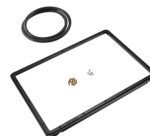
1520PF Cadre de panneau pour application spéciale