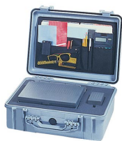
1509 Pochette couvercle