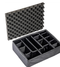
1525 Cloison en mousse