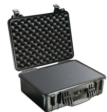
1520WF With Foam