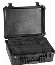
1526 With Convertible Travel Bag