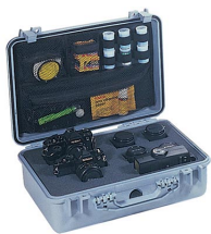
1508 Pochette couvercle photographe