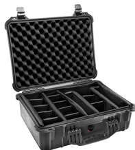
1524 With Padded Dividers