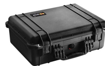
1520NF No Foam