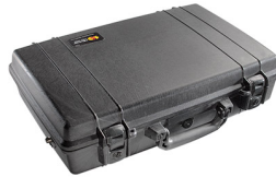
1490NF No Foam