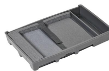
1499C Fond insérable pour ordinateur