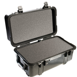
1460WF With Foam