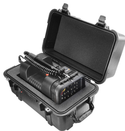
1460AALG With Custom Foam for 9430 / 9435