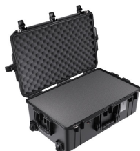
1595WF With Foam