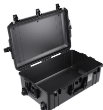
1595NF No Foam