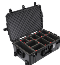
1595TP With TrekPak Divider System