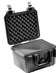
1300WF With Foam