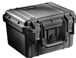
1300NF No Foam