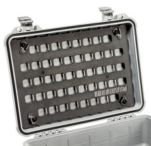
1500MP EZ-Click™ MOLLE Panel