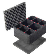
1200TPKIT Kit de séparation de la valise TrekPak