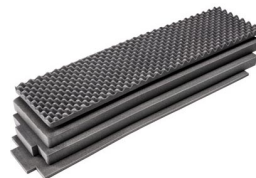
1755AirFS Jeu de mousses de rechange, 4 pièces