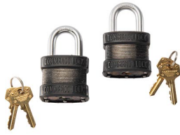
PL2 Cadenas (ensemble de 2)