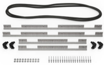
iM3075-BEZEL-LID Trousse de cadre de couvercle