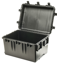
iM3075-X0000 No Foam