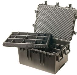
iM3075-X0002 With Padded Dividers