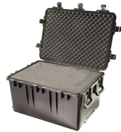
iM3075-X0001 With Foam