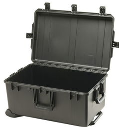
iM2975-X0000 No Foam