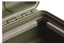
iM29XX-BEZEL Support de platine base