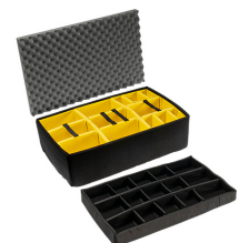
iM2975-DIV Cloison en mousse