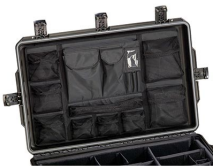
iM29XX-UTILITYORG Pochette utilitaire