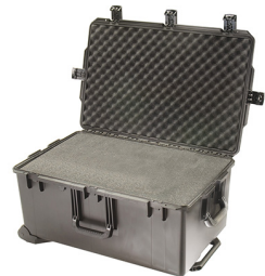
iM2975-X0001 With Foam