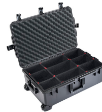
iM2950-X0006 With TrekPak Divider System