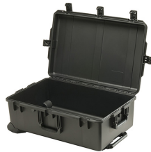
iM2950-X0000 No Foam