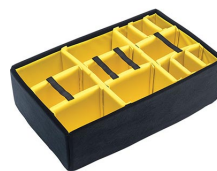
iM2950-DIV Cloison en mousse