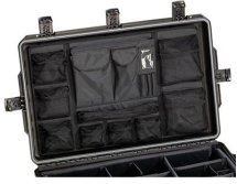
iM29XX-UTILITYORG Pochette utilitaire