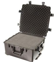
iM2875-X0001 With Foam