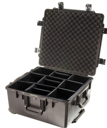
iM2875-X0002 With Padded Dividers