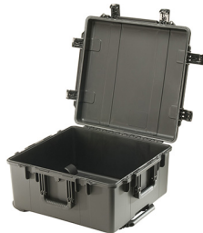
iM2875-X0000 No Foam