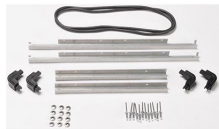
iM27XX-BEZEL-LID Trousse de cadre de couvercle