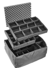
iM2750-DIV Cloison en mousse