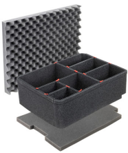
iM2720TPKIT Kit de séparation de la valise TrekPak