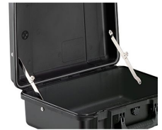
iM-LIDSTAY Compas de couvercle