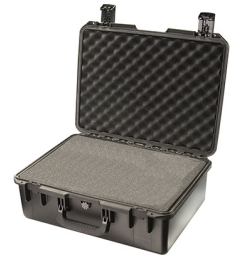
iM2600-X0001 With Foam