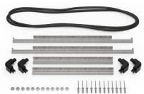
IM2600-BEZEL-LID Trousse de cadre de couvercle