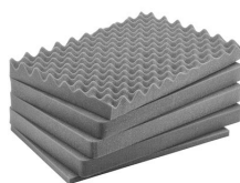
IM2600-FOAM Jeu de mousses de rechange, 5 pièces