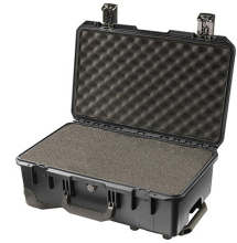
iM2500-X0001 With Foam