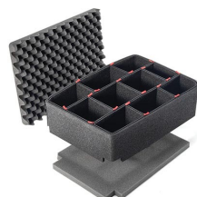
iM2500TPKIT Trousse de séparateurs pour coffre TrekPak