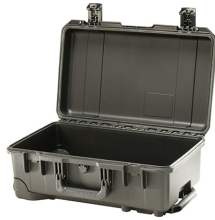
iM2500-X0000 No Foam