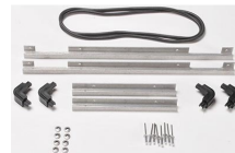
iM2500-BEZEL-LID Trousse de cadre de couvercle