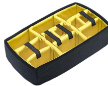
iM2500-DIV Cloison en mousse