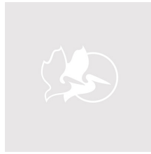
iM2500-X0002 With Padded Dividers