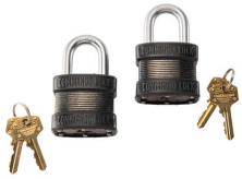
PL2 Cadenas (ensemble de 2)