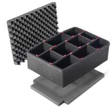
iM2450TPKIT Trousse de séparateurs pour coffre TrekPak