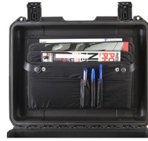
iM24XX-LIDORG Pochette couvercle