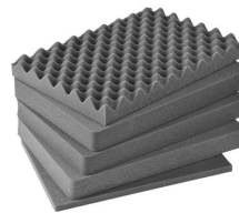
iM2450-FOAM Jeu de mousses de rechange, 5 pièces