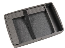
iM2370-COMPTRAY Plateau d'ordinateur