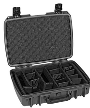
iM2370-X0002 With Padded Dividers