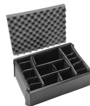
iM2370-DIV Cloison en mousse