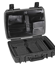
iM2370-X0003 Computer Case Deluxe