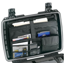
iM2370-UTILITYORG Pochette utilitaire