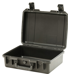
iM2300-X0000 No Foam