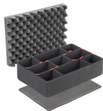
iM2300TPKIT Kit de séparation de la valise TrekPak