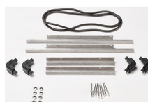
IM2300-BEZEL-LID Trousse de cadre de couvercle