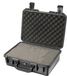
iM2300-X0001 With Foam