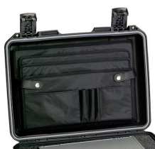
IM2300-LIDORG Pochette couvercle