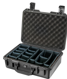
iM2300-X0002 With Padded Dividers