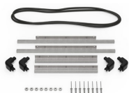
iM2300-BEZEL-LID Trousse de cadre de couvercle