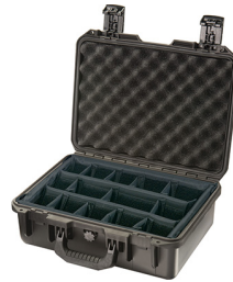
iM2200-X0002 With Padded Dividers