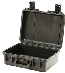
iM2200-X0000 No Foam