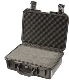
iM2200-X0001 With Foam