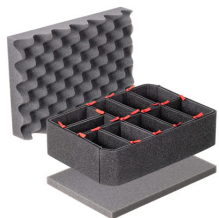
iM2100TPKIT Kit de séparation de la valise TrekPak