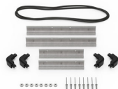
iM2100-BEZEL Support de platine base