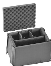
iM2075-DIV Cloison en mousse