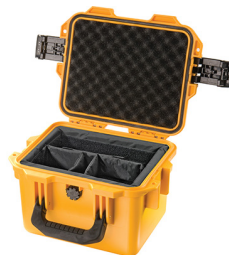
iM2075-X0002 With Padded Dividers