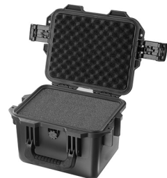
iM2075-X0001 With Foam