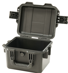
iM2075-X0000 No Foam