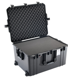
1637WF With Foam