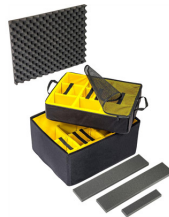
1637AirDS Cloison en mousse