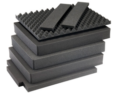
1637AirFS Jeu de mousses de rechange, 7 pièces