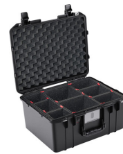
1557TP With TrekPak Divider System