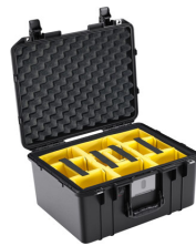
1557WD With Padded Dividers