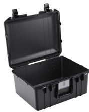
1557NF No Foam