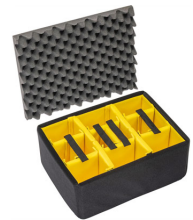
1557AirDS Cloison en mousse