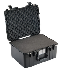
1557WF With Foam