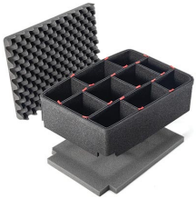
1557TPKIT Trousse de séparateurs pour coffre TrekPak