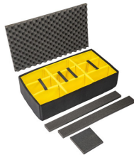
1615AirDS Cloison en mousse