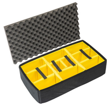
1605AirDS Cloison en mousse