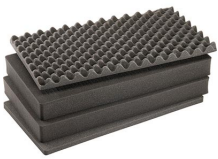
1605AirFS Jeu de mousses de rechange, 4 pièces