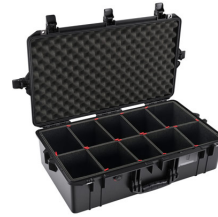
1605TP With TrekPak Divider System