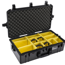
1605WD With Padded Dividers