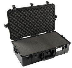
1605WF With Foam