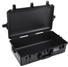
1605NF No Foam