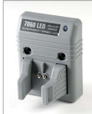
派力肯 7060 LED 充电器底座